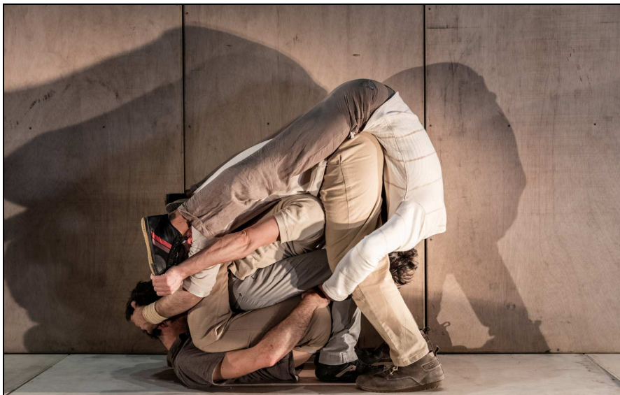
Espectacle InTarsi, de la Cia. EIA

*10€. Entrades a la venda a www.sabadell.cat/cultura