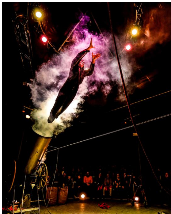
David Dimitri i el seu espectacle L'Homme Cirque .

La Fira del Circ de Catalunya programa 9 espectacles de sala per potenciar el circ als teatres i equipaments