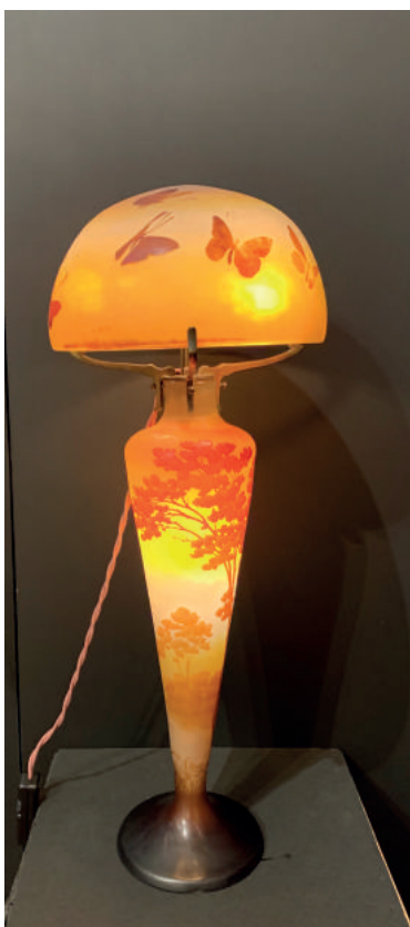
Llum sobretaula Emile Gallé Galeria Olga de Sandoval