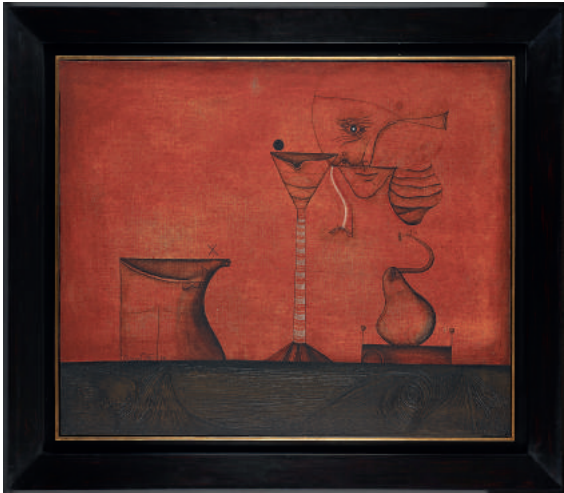
Modest Cuixart Galeria Dolors Junyent