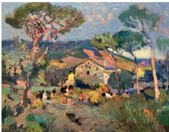
La Masia Joaquim Mir Galeria Jordi Pascual