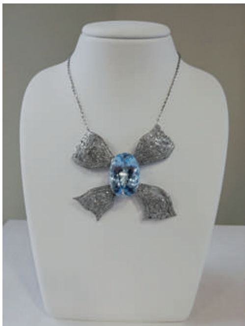
Colgante Art Decó Aguamarina y brillantes Joyas Antiguas River