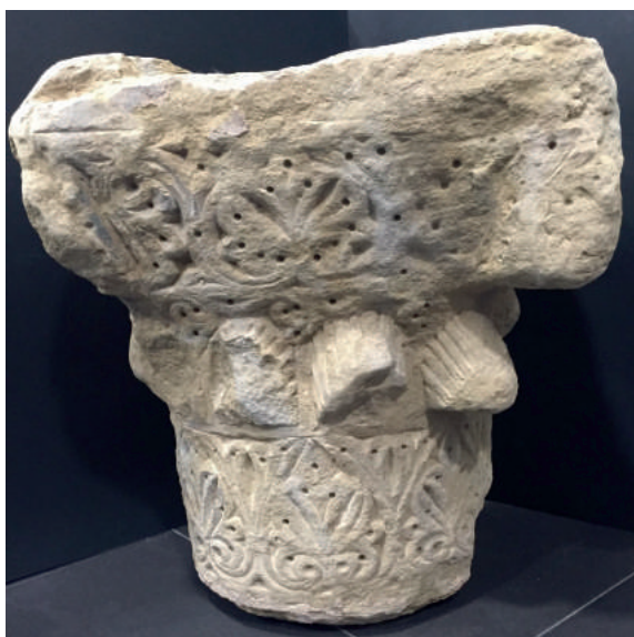
Capitel piedra Nazarí SXII Antigüedades Altabella