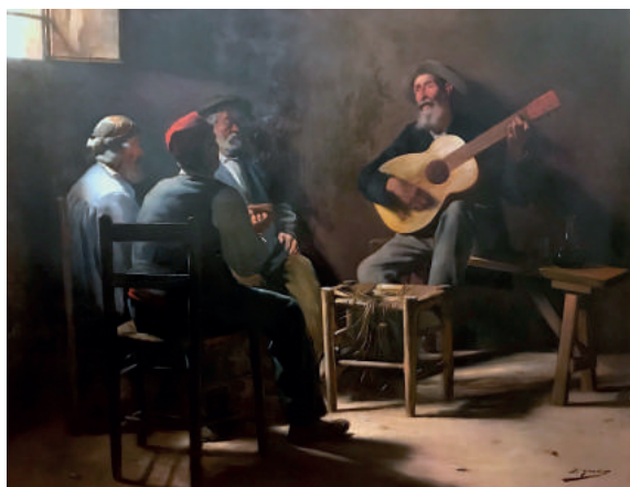
Concert a la taberna Lluís Graner Art Petritxol