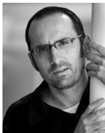
Toni Orensanz autor