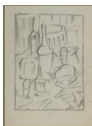
Naturaleza cubista Museu de l'Hospitalet