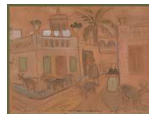
Hospitalet Museu de l'Hospitalet

La mostra es completa amb una sèrie de pintures originals d'aquest artista que es pot considerar com un dels referents de la pintura de l'Uruguai, juntament amb Joaquim Torres-García .