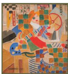
Barcelona 1918 Museu de l'Hospitalet

El vincle entre l'artista uruguaià Rafael Barradas (1890-1929) i la ciutat de L'Hospitalet, és l'eix central de la mostra que es durà a terme en aquesta Biennial i que s'exposarà a la sala l'Harmonia de L'Hospitalet des d'aquest 29 d'abril i fins el proper 30 de maig. L'exposició consta de deu plafons que il·lustraran les diverses activitats que va desenvolupar en aquesta ciutat durant els anys 1926-1928, el bienni en que es va instal·lar a una casa que es va acabar coneixent amb el sobrenom de l'Ateneillo, i en la que es reunien tot un seguit de personatges del món artístic i cultural de l'època.