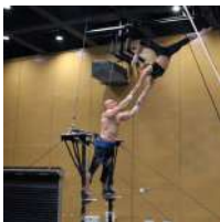
Deserve to Fly (Rusia) Portor coreano