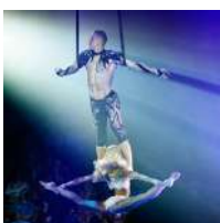
“Closing eyes” (Rusia) Cintas aéreas