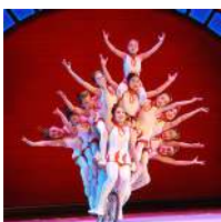
Yinchuan Acrobatic Troupe (China) Acrobacia en bicicleta / Monociclos