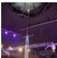
Troupe Volozhanin (Rusia) Equilibrios en escalera