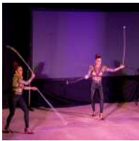
Argendance Girls (Argentina) Malambo