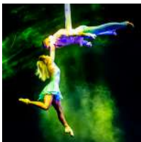
Duo Anishchenko (Rusia) Cintas aéreas