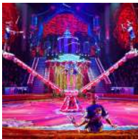
Troupe Sherbakov (Rusia) Malabares en grupo