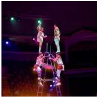
Hassak Troupe (Kazajistán) Equilibrios en escaleras