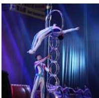
Anhui Acrobatic Troupe (China) Equilibrio de bancos / Saltadores de aros