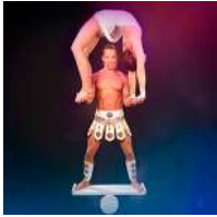
Duo Dádiva (Cuba) Acrobacias en el rola rola