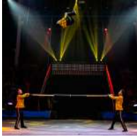
Trio Poselskii (Rusia) Barra rusa